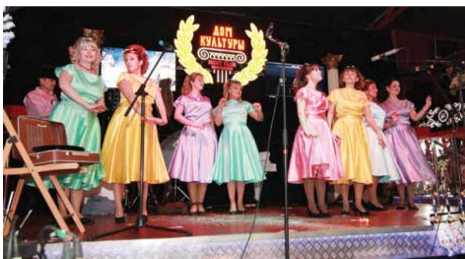
Лауреаты III степени детский сад №62

Победителем в этом году была признана команда 45-го детского сада с песней «Коляда». Всё в этом номере было выверено до мелочей: невероятно красочные костюмы в русском народном стиле, правильные танцевальные движения, прекрасное исполнение сложнейшей песни и, конечно, харизма участников. Всем сразу же захотелось колядовать!