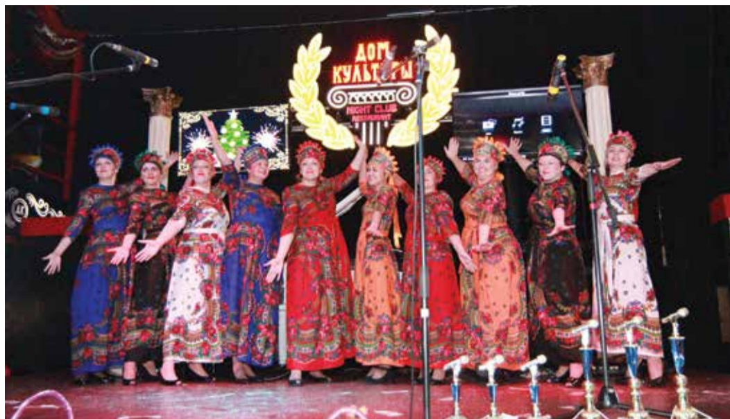
Лауреаты I степени детский сад №45

За окном плюсовая температура, дождь. Наша петербургская зима. Но если вы попадёте сюда, то даже такая, совсем не зимняя погода, не сможет помешать вам обзавестись праздничным настроением и настроиться на новогоднюю, музыкальную волну! Ведь мы на «Битве хоров»!