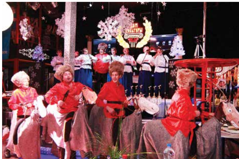
Лауреаты II степени школа №38