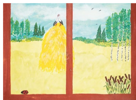
«Российские просторы», лауреат 3 степени Арсений Чайников