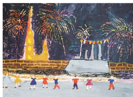
«Праздничный Санкт-Петербург», лауреат 2 степени Мария Петрова