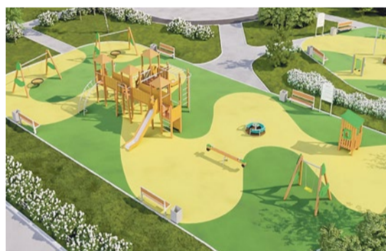
Комендантский проспект, 21, к. 1