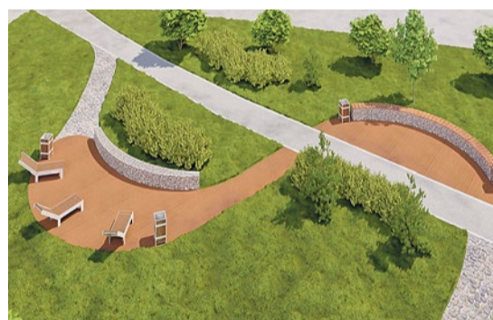
Комендантский проспект, 21, к. 1

История празднования 1 мая насчитывает более 130 лет. Конец XIX века в России был ознаменован бурным ростом промышленности и новых социальных отношений, которые быстро переросли в революционное движение. Год от года первомайское движение набирало силу. Уже в 1914 году в забастовках участвовало около 500 тыс. человек. После Октябрьской революции праздник стал государственным, ежегодно устраивались шествия профсоюзов и громкие парады. Со временем политический окрас терялся, и уже после распада СССР, в 1992 году, день переименовали в Праздник Весны и Труда.