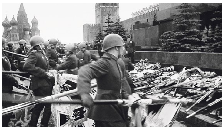
Низвержение фашистских штандартов к подножию мавзолея В. И. Ленина

Первый российский парад прошел в 1995 году и был реконструкцией исторического парада 1945 года, наземную часть парада дополнил строй из 79 самолетов и вертолетов.