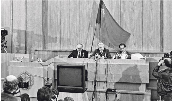
Председатель Верховного Совета РСФСР Борис Ельцин дает пресс-конференцию, посвященную принятию Декларации о государственном суверенитете РСФСР (26 июня 1990 года)

День рождения современной России ежегодно отмечается 12 июня. В этот день, в 1990 году, была принята Декларация о государственном суверенитете РСФСР. Интересно, что именно 12 июня помимо «независимости» Россия обрела и первого Президента – в этот день, на следующий год после принятия Декларации состоялись первые в истории страны всенародные открытые выборы президента, на которых победу одержал Борис Ельцин. Именно он своим указом № 1113 от 2 июня 1994 года придал 12 июня государственное значение, а сам праздник получил название – «День принятия Декларации о государственном суверенитете Российской Федерации».