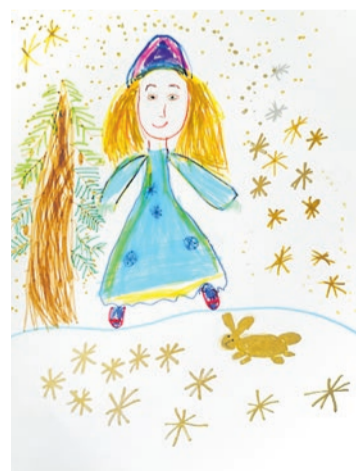
Добрыня Курило, «Мама – Снегурочка лесная»