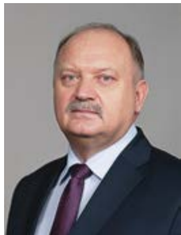
Уважаемые депутаты, муниципальные служащие и работники органов местного самоуправления!

От всей души поздравляю вас с профессиональным праздником!