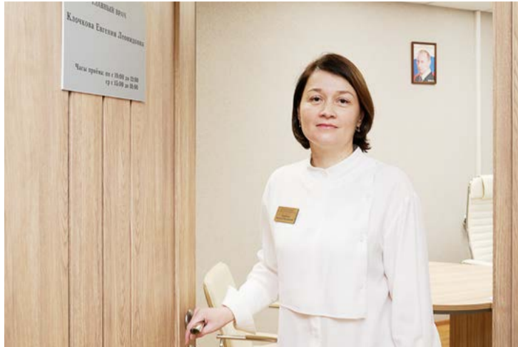
Депутаты муниципального совета и сотрудники местной администрации МО Озеро Долгое от всего сердца поздравляют коллектив поликлиники № 111 с юбилеем и желают успехов в профессиональной деятельности!

Коллектив из 79 врачей и 87 медицинских работников продолжает развивать лучшие традиции учреждения, более половины сотрудников имеют высшую квалификационную категорию.