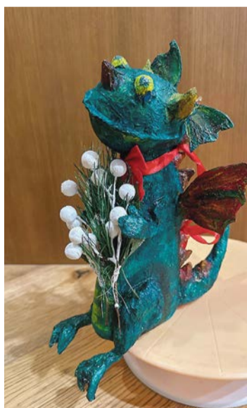
«Праздничный дракон», Сергеева Ксения, 10 лет