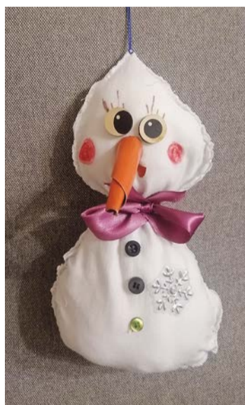
«Снеговик Снежок», Курило Добрыня, 8 лет

В конкурсе приняли участие юные жители округа от 5 до 11 лет. Вместе с родителями они создали чудесные игрушки, чтобы украсить новогоднюю красавицу. В творчестве ребят не ограничивали – каждый участник подошел к работе креативно. С начала месяца