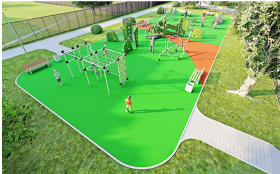
Проект площадки на Комендантском проспекте, 17, к. 2