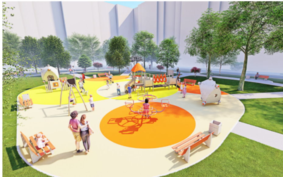
Проект площадки на проспекте Королева, 32, к. 2