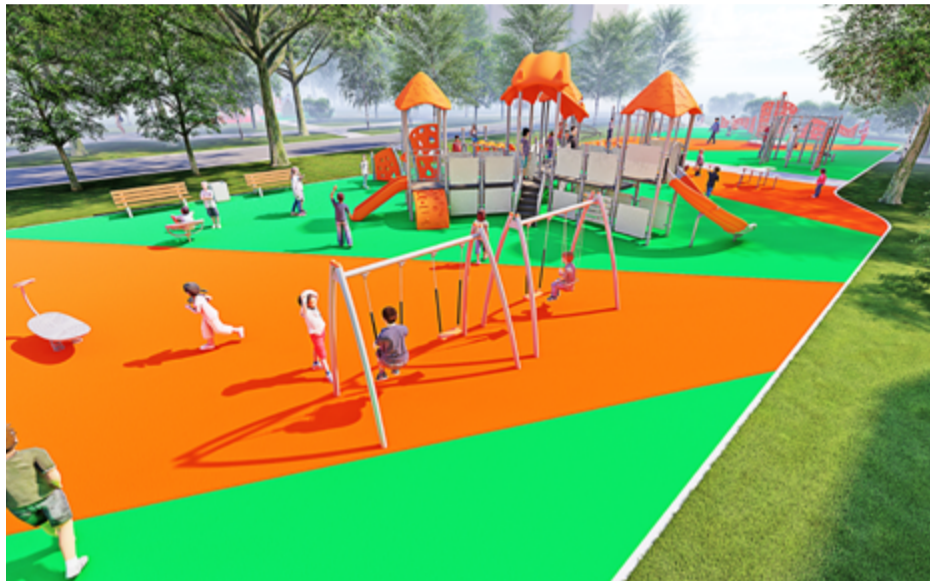
Проект площадки на Коменданском проспекте, 19, к. 3